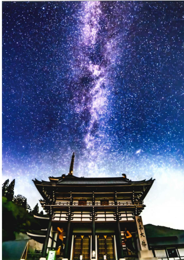
【大門を照らす天の川】