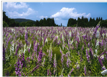
【小城集落を蔽うジキタリス】